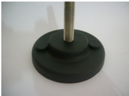
HASTE EM AÇO-INOX-304