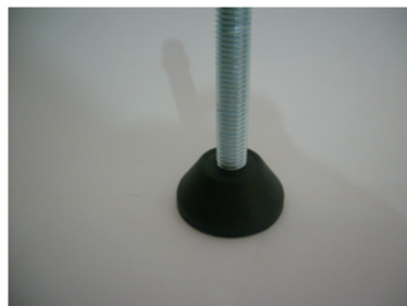
HASTE EM FERRO ZINCADO