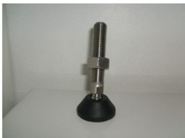
HASTE EM AÇO-INOX-304