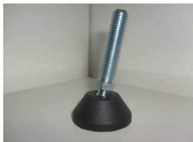
HASTE EM FERRO ZINCADO